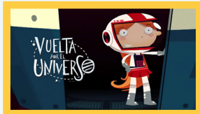
Vuelta por el Universo