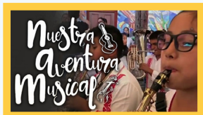
Nuestra Aventura Musical