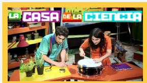
La Casa de la Ciencia