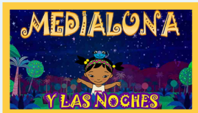
Medialuna y las Noches Magicas