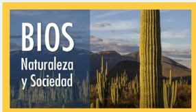
Bios: Naturaleza y Sociedad